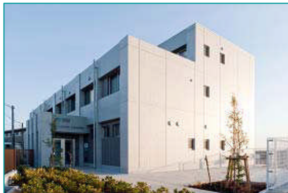
本社内に宿泊施設付きの研修センターをオープン致しました。 販売店様向けの研修はもちろん社内教育まで幅広く活用しております。

2010年度の主な環境教育は、「新入社員EMS教育」、新しくEMS活動の部門管理責任者向けの「新任管理者研修」、営業部門向けの「改正省エネ法研修」、「廃棄物の適正処理研修」などを行いました。また、社外向けには、当社販売品のコンプレッサに関する「省エネセミナー」を実施しました。