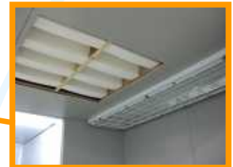
給気フィルタ写真