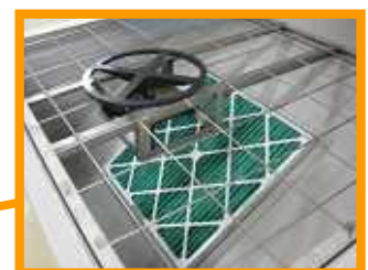
吸込みフィルタ写真