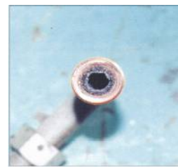
カーボンが堆積した配管