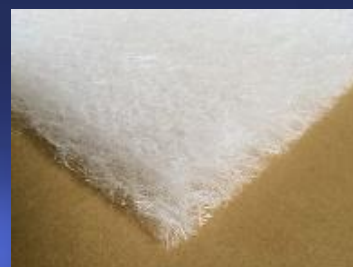
2次フィルタセット