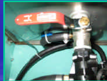
ドレンバルブ閉の状態

扉を開けるとドレンバルブがあります。ドレンバルブが開いているか確認してください。開いていないとドレンは流れません。