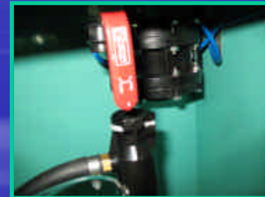
ドレンバルブ開の状態